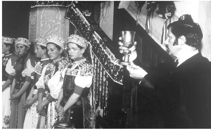
Figure 4 The Lord's Supper celebrated at Bánffyújnyad, with girls being confirmed as church members. Note the commemorative wreaths with ribbons in the colours of the Hungarian flag.