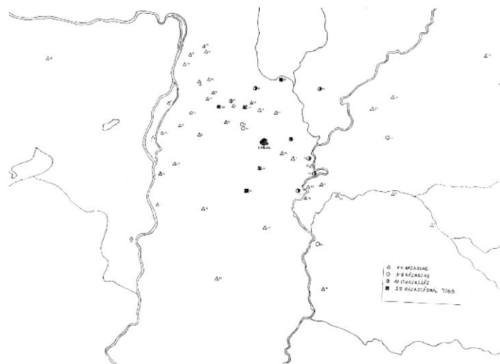
Házassági kapcsolatok 1723–1810.

Tápióbicske 1, Tápiószele 1, Tápiószentmárton 1, Tiszaföldvár 2, Tiszakürt 1, Törtel 1, Üllő 2, Veresegyház 1.