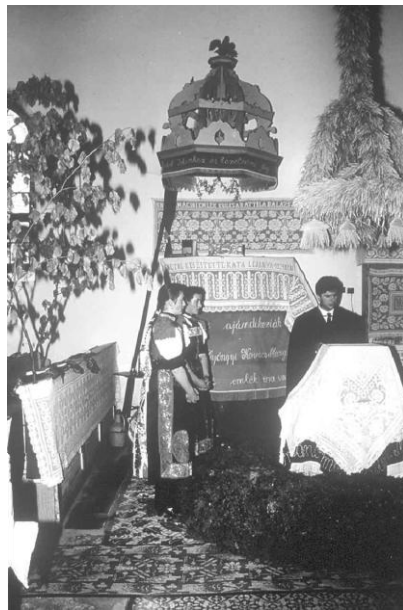
Figure 3 Interior of Nyárszó church, with embroidered texts, ornate pulpit and harvest-time bell. Green branches decorate the church for the confirmation communion service.