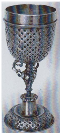
1. Kis serleg . Abaujszántó – Abauji Református Egyházmegye TIREK