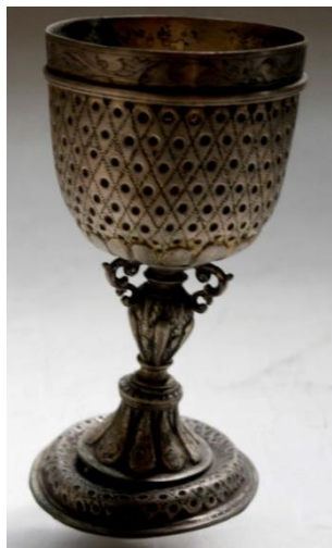
3. Kis serleg . Komáromcsehi – Komáromi Református Egyházmegye SZRKE

Az Ungi Egyházmegyében a református gyülekezetekben Erdély és Felső-Magyarország ötvössége találkozott. A közeli Ráton nagyszebeni, Nagygejőcön kassai készítésű kehelyt őrzött meg a gyülekezet. 7 Mivel a kis kehely jelzéssel nincs ellátva, nem zárhatjuk ki egyik helyről történő származását sem, bár formailag eltér az erdélyi hasonló pontsordíszes közölt példától.