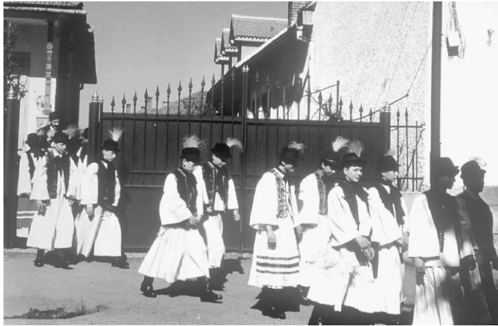
Figure 2 Boys in Bánffyhungad on their way to their Confirmation service.