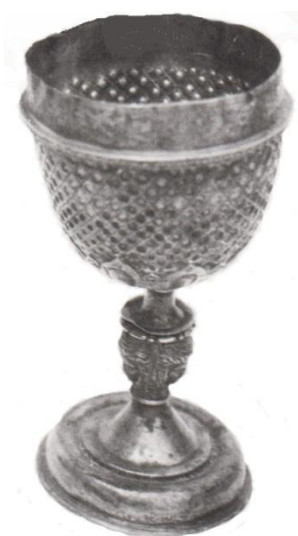
5. Kis kehely. Jánd – Szabolcs-Beregi Református Egyházmegye TTRE

Mindezek hiányában csupán a tárgyhoz kapcsolható analógi-ák keresésével próbálkozhatunk. Itt ismét Kiss Erikára utalhatunk, aki egy hasonló példányt Felső-Magyarországon készültnek tekintett. Véleményét elfogadva, szintén az itteni ötvösközpontokban készültnek véljük, közelebbi meghatározás nélkül.